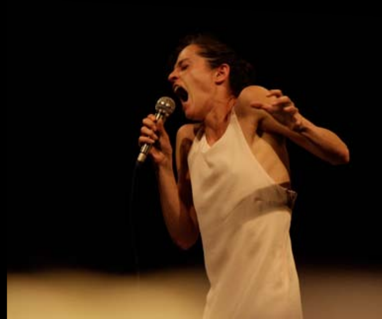
CRÉATION 2014 PARC D'ATTRACTION(S)