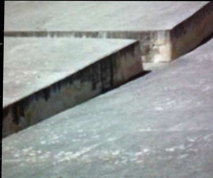
CRÉATION 2015 CHTO