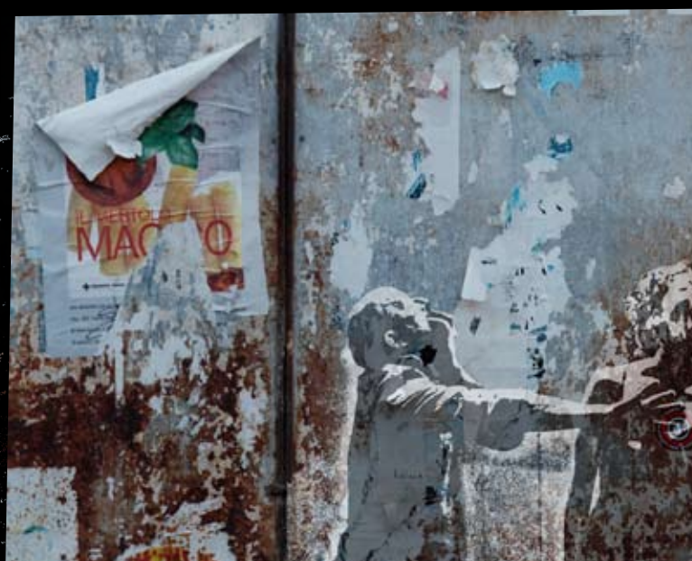
CRÉATION 2016 NO(W) HOPE