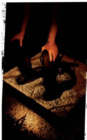
"Pour rire Pour passer le temps" à Mourenx / Texte de Sylvain Levey