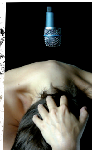
"No(w) Hope" / Esquisses de la création 2016 à Pau, Marseille et Toulouse / Co-signée avec Manon Avram (Collectif KO.com)

Mercredi 21 Octobre 2015 à 20h / Festival "Question de danse" / Klap Maison pour la danse / Marseille (13) No(w) Hope / Esquisse #02 / Théâtre-Danse-Image / Co-signée avec Manon Avram - Collectif KO.com